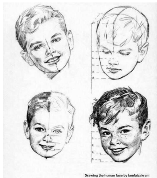
Drawing the human face by lamfaizakram

Yuzdagi chiziqni ayniqsa yuqori lab ustidagi burunning chizig'ini muloyimlik bilan chizing. Asta sekin qorong'ulikdan yorug'likka o'tish uchun yorug'lik o'tishlarini muloyimlik bilan shtrixlang.