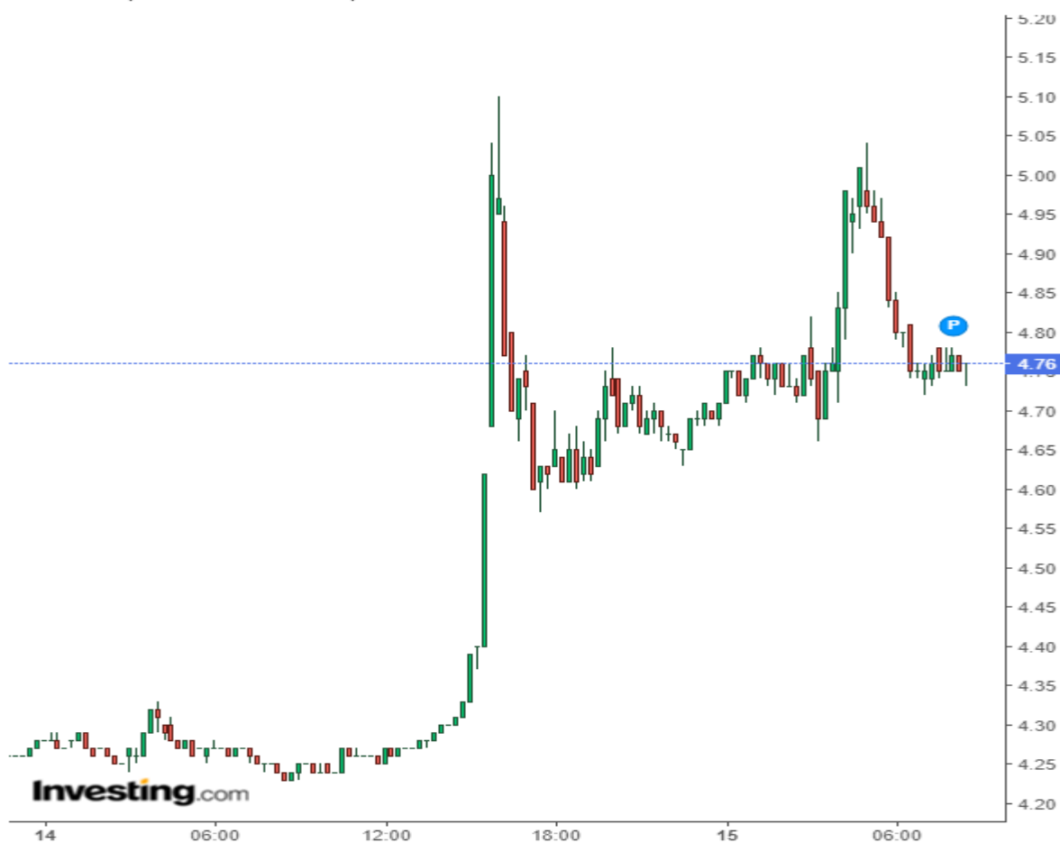
Дневной график AXS/USDT.

Published on Investing.com, 15/Sep/2023 - 5:45:26 GMT, Powered by TradingView. AXS/USD, Binance:AXS/USD, 15