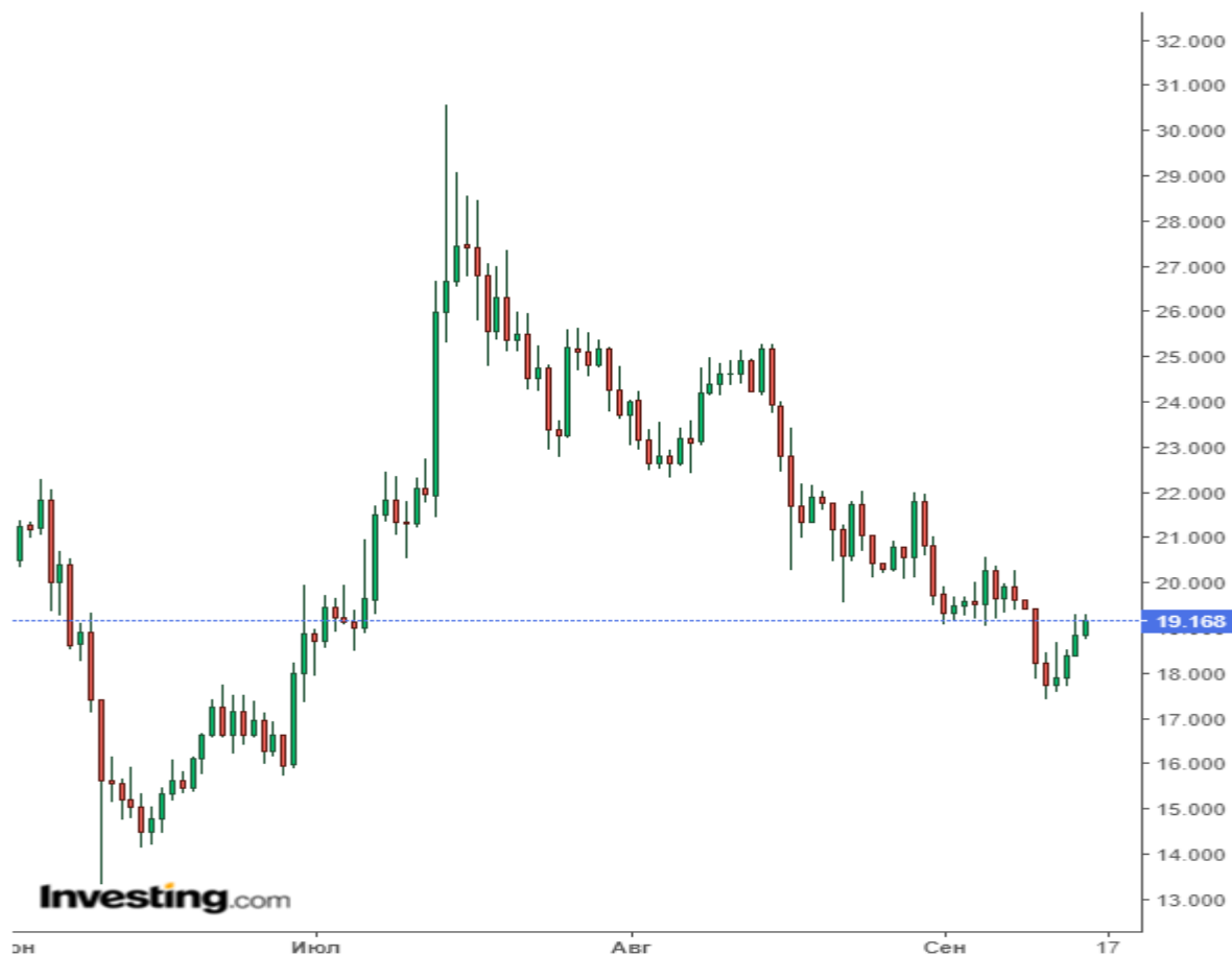
Дневной график SOL/USDT. Источник: TradingView

Published on Investing.com, 15/Sep/2023 - 5:47:53 GMT, Powered by TradingView. Solana, Investing.com: SOL/USD, D