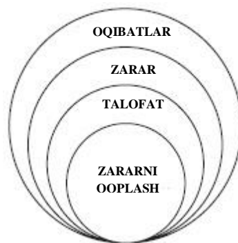
1-rasm. Favqulodda vaziyatlarning tabiiy va iqtisodiy oqibatlari o'rtasidagi nisbat

Texnogen va tabiiy favqulodda vaziyatlar o'z ko'lamiga qarab shaxs, jamiyat va umuman davlat hayotining turli sohalariga ta'sir ko'rsatadigan oqibatlarga olib keladi. Natijalar favqulodda vaziyatdan keyin ham, nisbatan uzoq vaqt davomida ham sodir bo'lishi mumkin. Umuman olganda, tabiiy va texnogen xususiyatli favqulodda vaziyatlarning ta'siri quyidagi zanjirga olib kelishi mumkin: oqibatlar - yo'qotishlar - zarar - qoplash. Zanjir elementlari orasidagi sifat munosabatlari 1-rasmda ko'rsatilgan.