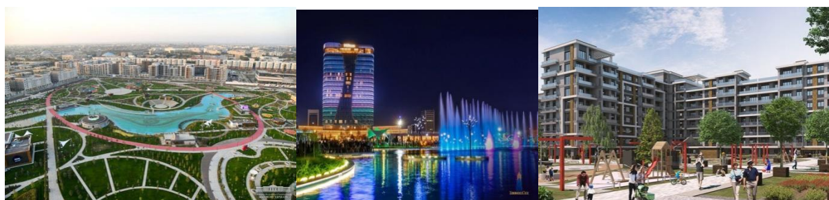
3-rasm. "Toshkent city"

bilan bitta bo'lgan. Sababi esa hozirgi vujudga kelgan "Toshkent city" majmuasining qurilish zonasiga tushib qo'lgan edi. Lekin shunday bo'lishiga qaramay bu binoning qaysidir ma'noda qurbon bo'lishi zo'ye ketgani yo'q. yurtimizda juda zamonaviy, beqiyos turar-joy majmualari, ko'ngil ochar bo'g va yana bir qancha jamoat binolari qad ko'tardi. Shunday bo'lsada loyihachilarimiz ushbu bino asosida taklif loyihalar ham yaratishlari mumkin edi. Bunday buzib tashlangan binolar esa afsuski juda ko'p. har bir bino o'zining tarixiga ega bo'ladi. Undagi qurilish materiallari, binoda ishlatilgan qurilish texnologiyalari hamda bino fasadini bo'yitib turuvchi elementlar o'sha davr atmosferasini o'zida aks ettirib turadi. Shu sababli ham loyihachilarimiz imkon qadar tarixiy binolarni inobatga olgan holda yangi loyihalar yaratishlari maqsadga muvofiq deb hisoblayman.