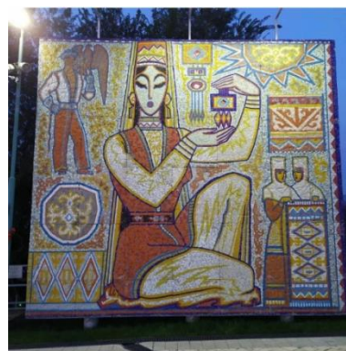
8-rasm. Mazaykalar hiyobonlarda dekorativ elementlar sifatida joylansa qanday ko'rinar edi.

Hozirgi kunda esa ko'chalarimiz, hiyobonlarimiz, umumam barcha binolarimiz reklamalar bilan to'lgan. Bu reklamalar ko'pligidan binoni dizayni uyoqda tursin, uni qanday binoligini ham bilib bo'lmaydi. Bir binoni o'zida bino uchun tegishli bo'lmagan o'nlab reklamalarni ko'rishimiz mumkin. O'zbekistonda birinchi tashqi reklama 1996-yilda paydo bo'lgan. U tezda poytaxt ko'chalarini to'ldirdi. Avvallari qo'l mehnati yordamida turli reklamalar rassomlar tomonidan ishlangan bo'lsa, keyinchalik bu ishni texnika vositalari bajara boshladi. Hozirgi kunga kelib esa video ekranlar orqali namoyish etiladigan video reklamalar avj olmoqda. Reklama shu darajada avj olib ketdiki har qadamda yuzlab turli hil reklalarni ko'rishingiz mumkin. Eng achinarlisi esa shuki bu reklamalar ko'paygani sari barcha binolarni butkul qoplab olmoqda. U bino savdo markaz binosi bo'lsa tushunsa bo'ladi, ammo tarixiy binolarni ham egallab olmoqda. Binoning fasad elementlari, unda ishlangan turli dekorativ elementlar, binoning asl qiyofasini aks ettiruvchi elementlar bahaybat reklama plakatlari ostida qolib ketmoqda. Bularni barchasiga chek qoymasak shahrimiz reklamalar shahriga aylanib bormoqda. Buning uchun esa shaxrimiz uchun yagona mukammal dizayn kodini ishlab chiqish lozim.