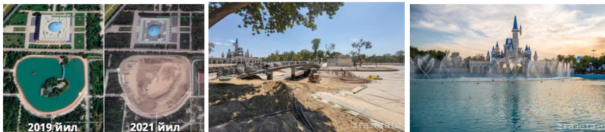
5-rasm. Milliy bog'ining ko'lining 2019-2021 yilgi suv sathi korinishlari. Hamda hozirgi kundagi ko'rinishi.

Hozirgi Milliy bog'ning vujudga kelishi. Bundan ko'p yillar avval 700 dan ortiq bola hasharga – o'z shahri uchun bog'-ko'l barpo etish uchun yo'l oldi. Bir yarim oy ichida ko'lining poydevori tayyor bo'ldi va 1939 yil 15 iyunda unga suv quyildi, komsomolchilar tomonidan qurilganligi sababli unga shunday nom berildi. Ko'l bog'ining tantanali ochilishi 1939 yil 3 iyulda bo'lib o'tdi. Bu ko'l uzoq yillar davomida yurtimiz mehmonlari va yurtdoshlarimizning mazmunli hordiq olishlari uchun xizmat qildi. Iqlim o'zgarishining oqibatida va hamda ma'sul shaxslarning be etiborliklari tufayli bu ko'l 2021- yilga kelib buntunlay qurib qoldi.