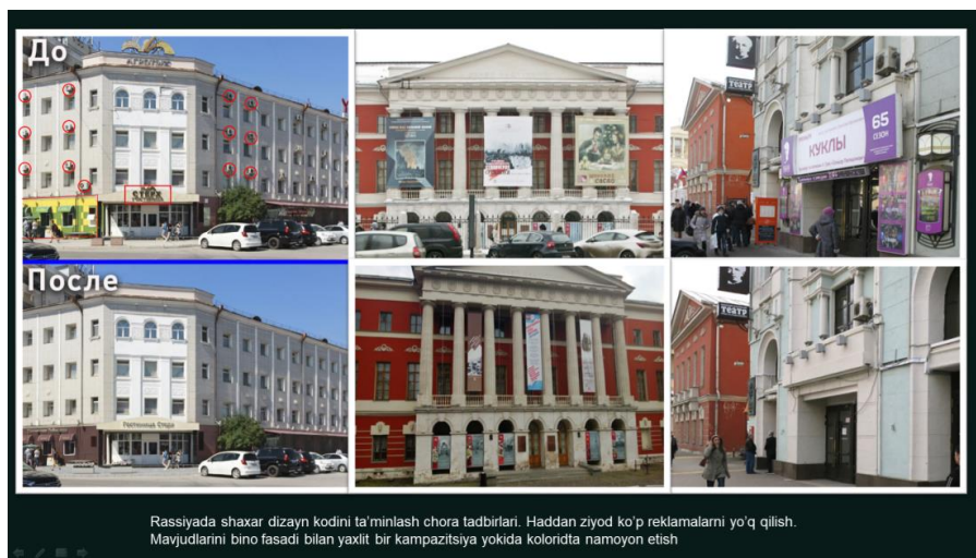
10-rasm. Rassiyada shaxar dizayn kodini ta'minlash maqsadidan reklamalardan ozod etilgan binolar.

Rassiyada shaxar dizayn kodini ta'minlash chora tadbirlari. Haddan ziyod ko'p reklamalarni yo'q qilish. Mavjudlarini bino fasadi bilan yaxlit bir kompazitsiya yokida koloritda namoyon etish. Qo'shni mamlakatlar allaqachon dizayn kod masalalari bo'yicha izlanishlar olib borib, ularni amaliyotga tadbiq etishmoqda. Reklamalar bilan kurashish, ularni butunlay yo'q qilish kerak degani emas. Reklama tadbirkorlar o'z biznesini yuritishi, uni ommaga tanitishi uchun kerak. Bu iqtisodimizning negizi. Ammo faqat buning uchun ham butun boshli shaxar dizayn kodini, o'zining asl sof qiyofasini yo'qqa chiqarish yaramaydi. Yuqorida Rossiya davlatida amalga oshirilgan reklamasiz binolarni ko'rib o'tdik. Ular maksimal darajada reklama 2-darajali element sifatida ko'rishimiz mumkin.