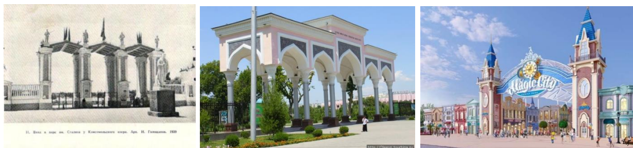
6-rasm. Hozirhi "Magic City" bog'ining evolyutsiyasi.

Buni ushbu rasmlarda ham ko'rishingiz mumkin. Ushbu ko'l batamom quriganidan song uni qayta tiklash ishlari boshlanadi va bog'ning barcha qisimlarida rekonstruksiya ishlari olib borilib bo'g' qaytadan bunyod etiladi. Hozirgi kunda esa ushbu bo'g' "Milliy bo'g' nomi bilan ataladi. Unda bir qancha adiblar hotirasiga bag'ishlangan haykallar, dam olish zonalari, va ko'pgina rekriatsion zonalarga bo'lingan.