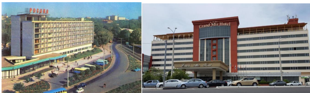
1-rasm. Toshkentda joylashgan "Rossiya" nomi bilan tanilgan, hozirgi kunda esa "Grand Mir Hotel" nomi bilan ataladigan mehmonhona.

Ushbu rasmda siz yurtimizning tarixiy binolar namunasi bo'lgan Rossiya mehmonxonasini ko'rishingiz mumkin. Yillar o'z ta'sirini ko'rsatmay qolmagan. Yaqin yillar davomida ushbu bino rekanstruksiya qilinib qayta foydalanish uchun topshirilgan. Ushbu bino loyihasida loyihachilarning muvafaqiyatli bajarilgan ish namunasi deb aytsak mubolag'a bo'lmaydi. Binoni tashqi fasad qismi zamonaviy tus olib uning nomi o'zgartirilgan. Lekin nomi o'zgargani bilan yurtdoshlarimiz uni avvalgi nomi bilan atashdan to'xtashgani yo'q.