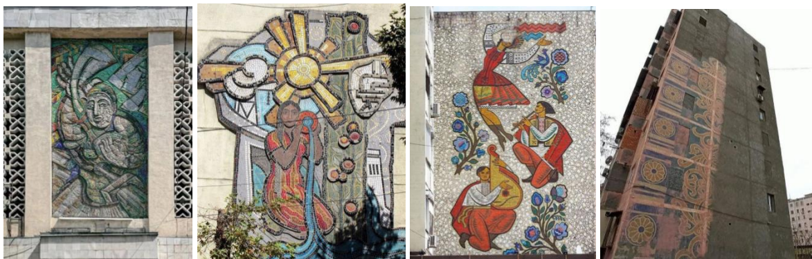
7-rasm. Yurtimizning ba'zi jamoat binolari hamda asosan ko'p qavatli binolariga ishlangan takrorlanmas mazayka san'at namunalari.

Yuqorida aytganimdek dizayn kod faqat katta hajmli ob'ektlarda namoyon bo'lmaydi. U har bir dekorativ elementlarda kattayu kichik arxitekturaviy elementlarda o'zini namoyish etadi. Navbatdagi e'tiboringizni qaratmoqchi bo'lgan ma'lumotim 80-90 yillar arxitekturasida keng qo'llanilgan "Mazayka"lar. Uzoq yillar davomida ular yurtimiz binolari ko'rkiga ko'rk qoshib kelayotgani hech kimga sir emas. Ularning har biri o'zgacha yashirin go'zallikni, chuqur o'ylangan ma'noga ega va bir binoga ishlangan san'at namunasi boshqa hech bir binoda takrorlanmaydi.