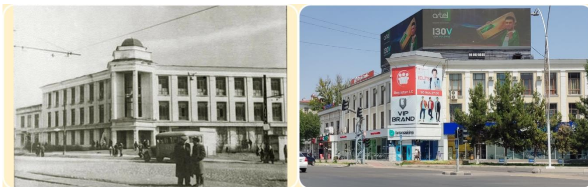
10-rasm. "Frunza savdo" binosi 1930-1936 yillar hamda hozirgi kundagi ko'rinishi.

Shaharlarimizda juda ko'p reklamalar, turli hil kerakemas e'lonlar, turli konstruksiyalari shu qadar avj olganki ko'chani umumiy dizayn kodi umuman inobatga olinmayapti. Kim nima hoxlasa shuni qilayotganga o'xshaydi go'yo. Buning isbotini esa quyidagi rasmlarda ko'rishingiz mumkin.