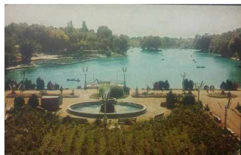
4- rasm. Komsomolskoye ko'lining tantanali ochilishi. 1939 yil Toshkent.