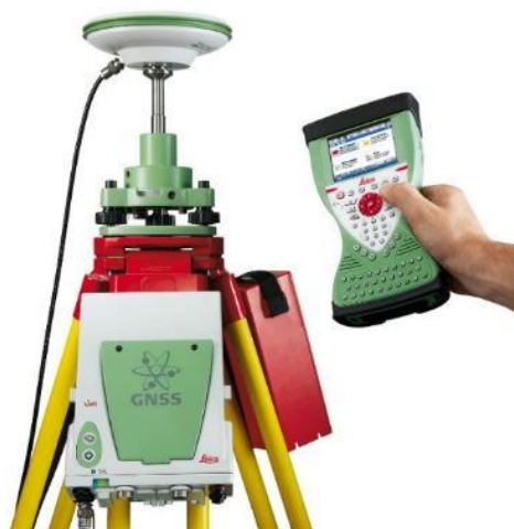
Рисунок 1. Приемник волн марки Leica GS-10

Приемники волн производятся в основном в США, Европе, России и Китае и коммерциализируются для топографических, геодезических, картографических и навигационных целей.