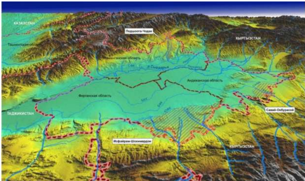
1-расм. Фарғона водийсининг космик сурат харитаси.

унда Ўзбекистон Республикасининг Андижон (4,2 минг км 2 ), Наманган (7,44 минг км 2 ), Фарғона вилоятлари (6,76 минг км 2 ) жойлашган ҳудуд 18,4 минг км 2 ни ташкил этади. Бундан ташқари, Фарғона водийси ғарб томонида Тожикистон Республикасининг Сўғд вилояти, жанубий ва жануби-шарқий томонида Қирғизистон Республикасининг Боткент, Ўш ва Жалолобод вилоятларини ўз ичига олади (1-расм). Водийнинг 3 та вилояти (Андижон, Наманган ва Фарғона) аҳолисининг умумий сони 2022 йил ҳолатига кўра 10,081 минг кишини ташкил этади.