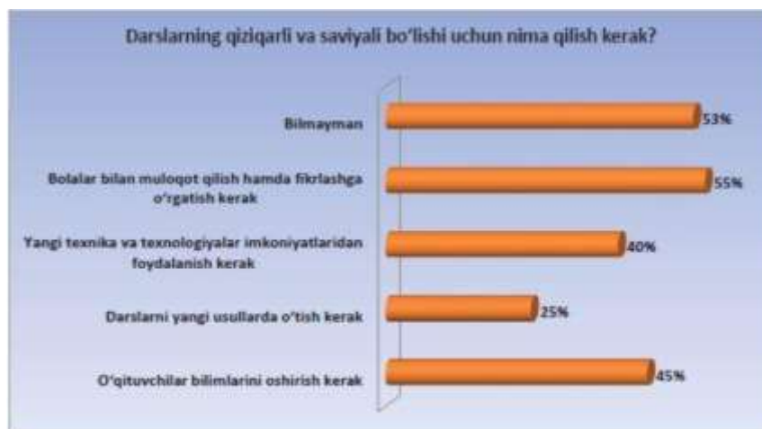
4-rasm. Darslarning o'smirlarga qiziq bo'lishi uchun nima qilish kerakligi borasidagi fikrlar (foiz hisobida)

Ota-onalar va ustozlar orasidagi ijobiy hamkorlik farzand tarbiyasida muhim o'rin egallaydi. Tadqiqot davomida o'qituvchilar ota-onalar bilan o'smirlarning tarbiyasi va xulq-atvori, muammolaridan ko'ra ko'proq tashkiliy masalalarda suhbatlashishi namoyon bo'ldi.