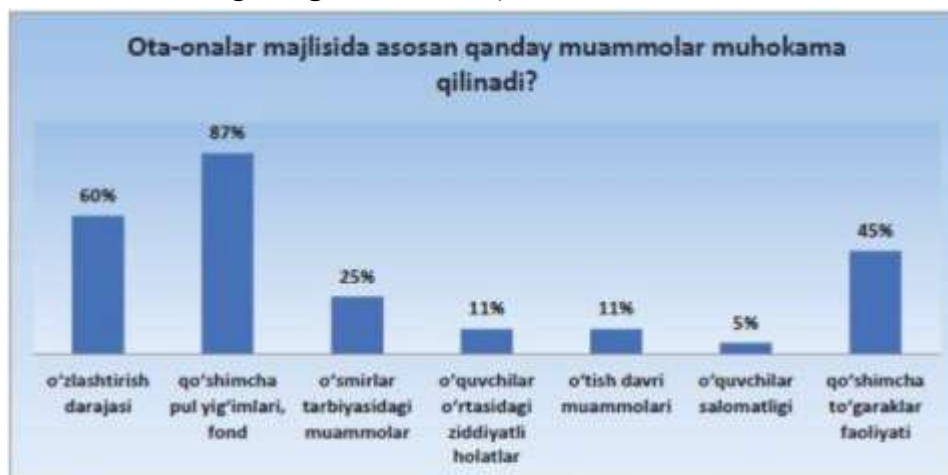
5-rasm. O'qituvchilar va ota-onalar o'rtasida qanday muammolar muhokama qilinishi borasida ota-onalar fikri (foiz hisobida)

Ota-onalar majlisida, asosan, qo'shimcha pul yig'implari (87%), bolalarning o'zlashtirish darajasi (60%), qo'shimcha to'garaklar faoliyati (45%) muhokama qilinadi. Keyingi o'rinlarda o'smirlar tarbiyasidagi muammolar (25%), o'quvchilar o'rtasidagi ziddiyatlar (11%), o'tish davri muammolari (11%) va o'quvchilar salomatligi (5%) masalalariga urg'u beriladi (5-rasm).