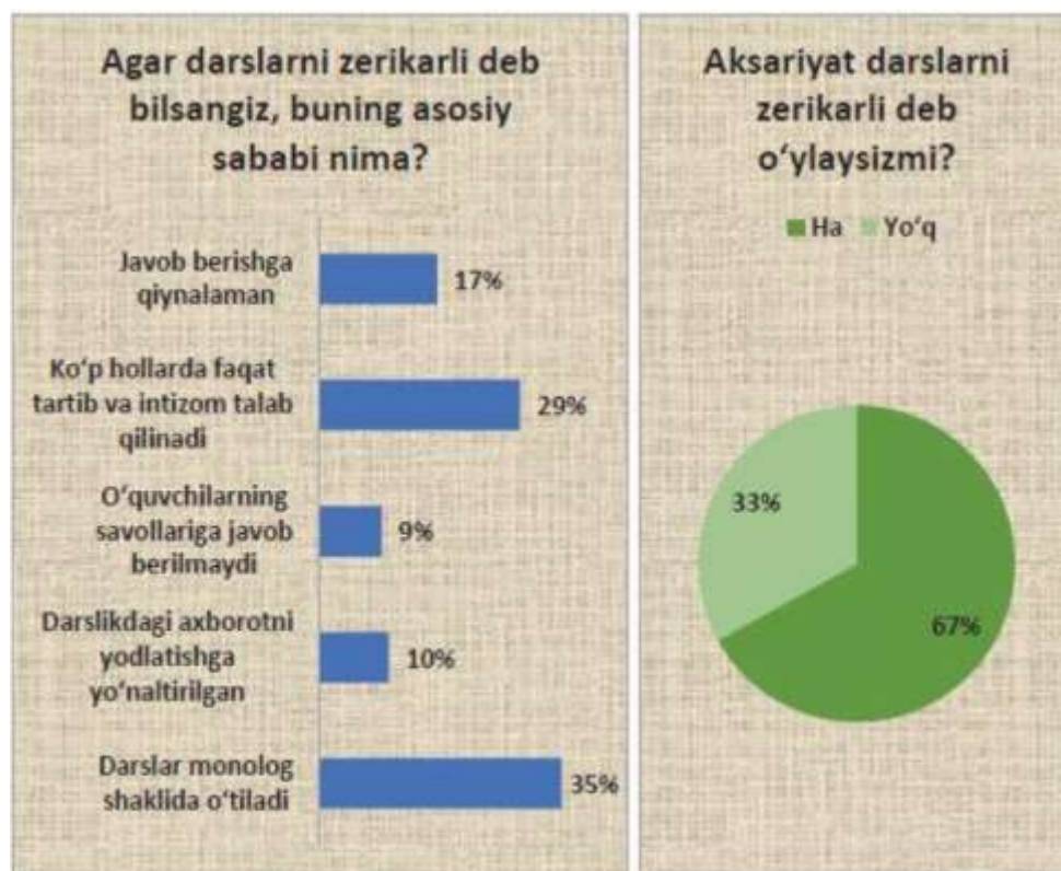
3-rasm. Darslar zerikarli bo'lishining sababi borasida ota-onalar va o'smirlar fikri (foiz hisobida)

O'smirlarning javoblari asosida darslarning qiziqarli bo'lishi uchun ustoz va o'quvchilar o'rtasida muloqot o'rnatilishi, mavzular muhokama qilinishi, o'qituvchilarning yangi zamonaviy bilimlarga ega bo'lishi hamda yangi multimedia texnologiyalari vositasida darslar qizg'in o'tilishining muhim ahamiyatga egaligi namoyon bo'ldi.