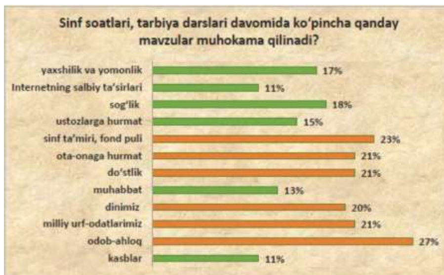
6-rasm. Sinf soatlari, tarbiya darslari davomida muhokama qilinadigan masalalar borasida o'quvchilar fikri (foiz hisobida)

Maktabdagi ta'lim darajasi va o'qituvchilarning o'z vazifalarini bajarishi ularning o'zlashtirishi past bo'lgan o'quvchilar bilan qo'shimcha ishlash holati bilan ham