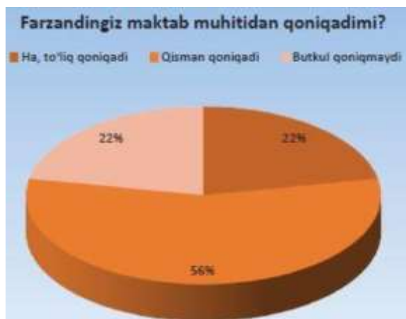
1-rasm. O'smirlarning maktab ta'limidan qoniqishi borasida ota-onalar fikri (foiz hisobida)

Respondentlarning 56 foizi maktab ta'limidan farzandlari qoniqmasligini, 22 foizi qisman qoniqishini va har beshinchisi butkul qoniqishini ma'lum qilishdi (1-rasm).