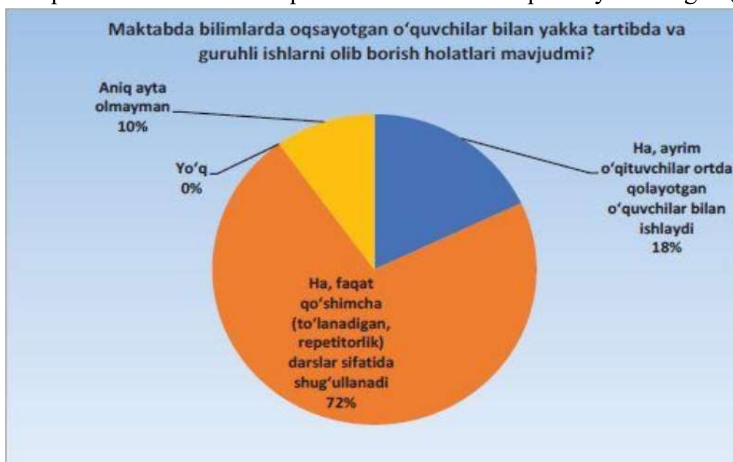
7-rasm. O'qituvchilarning o'zlashtirishi past bo'lgan o'quvchilar bilan ishlashi borasida ota-onalar fikri (foiz hisobida)

72 foiz respondent o'zlashtirishi past bo'lgan o'quvchilar o'qituvchilari tomonidan qo'shimcha to'lov evaziga o'qitilishini qayd etgan. 18 foiz holatlarda ayrim o'qituvchilar o'z kasbiy vazifasi doirasida ortda qolgan o'quvchilar bilan qo'shimcha ishlashi aniqlandi. Har o'ninchi respondent bu borada aniq fikr ayta olmagan (7-rasm).