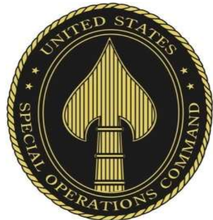
2-rasm. AQSH Maxsus operatsiyalar qo'mondonligi shtampi.

Maxsus operatsiyalar kuchlari yaratilish maqsadi etib, yangi yagona qo'mondonlik AQSh maxsus operatsiyalar kuchlarini birlashtirish va ularga yuklangan vazifalarni bajarishga tayyorlash maqsadida tashkil etilgan bo'lib, operatsiya jarayonini rejalashtirish va boshqarish, maxsus operatsiya o'tkazishning rahbari sifatida vakolatini o'z zimmasiga olgan taqdirda esa shaxsan Prezident yoki Mudofaa vaziri tomonidan amalga oshiriladi (2-rasm).