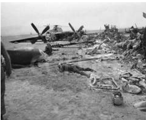
1-rasm. "Burgut panjasi" operatsiyasi 1980-yil.

Operatsiya boshlanishidan oldin tekshiruv komissiyasini o'tkazish orqali yana bir jiddiy xatoning oldini olish mumkin edi. Parvoz vaqtini aniqlashda soatlik noto'g'ri hisoblash amalga oshirildi, buning natijasida bortida Delta bo'lgan C-130 tashuvchilari Cho'l-1 hududiga kerak bo'lganidan bir soat oldin yetib keldi. Aynan shu soatda ichida 45 nafar Eron fuqarosi bo'lgan avtobus yo'lda paydo bo'lib, to'g'ri qo'nish zonasi markaziga kirib ketdi. Barcha eronliklar asirga olindi. Bir necha daqiqadan so'ng, qarama-qarshi tomondan yoqilg'i ortilgan avtomobil paydo bo'ldi va u tankka qarshi raketa bilan to'xtatilgunga qadar o'z ishini davom ettirdi. Shundan so'ng amerikaliklarga tungi ko'rish ko'zoynaklariga ehtiyoj qolmadi [2,3].