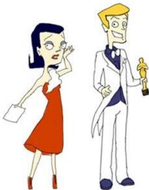
Он = Она

Различают «женские» и «мужские» профессии. А некоторые названия используются для обоих полов. Посмотрите на картинки ниже.