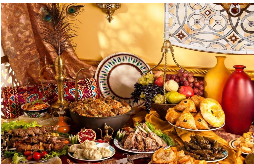
Рис.7.Гастрономия в Узбекистане

В Самарканде такой дегустационный тур на винное предприятие уже проводится. В горных же территориях этих областей, в программе дегустационного тура можно предложить посещение пасек и дегустацию сотового меда и других продуктов пчеловодства. А местные пастухи могут рассказать многое из своей работы, предложить чашку молока и рассказать о технологии изготовления курта или сюзьмы. (Рис.7)