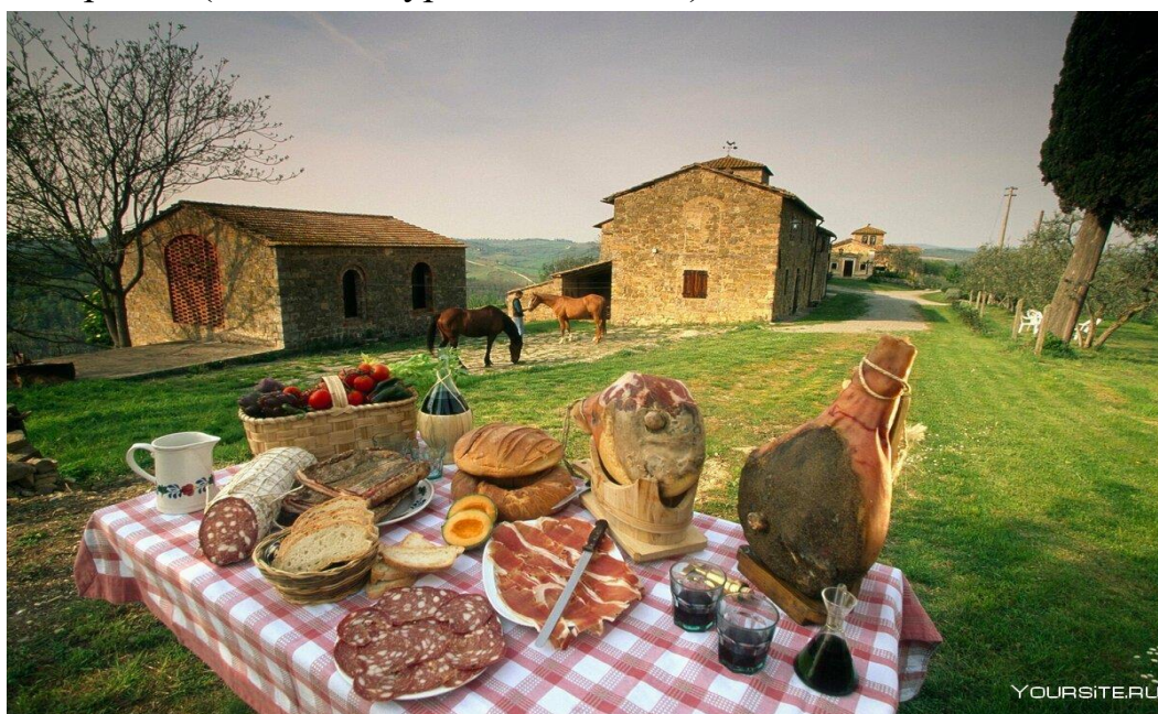
Рис.3.Экотуризм в Италии

Итальянская модель делится на три основных направления по специфике предоставления услуг. Это совмещения типичного отдыха в сельской местности с восстановлением здоровья (экотуризм), изучением гастрономии и продуктов местного производства, которые отличаются ввиду их территориальной расположенности, а также занятия спортом. Размещение туристов происходит в апартаментах и комнатах. Иногда встречаются палаточные городки. (Рис.3.Экотуризм в Италии)