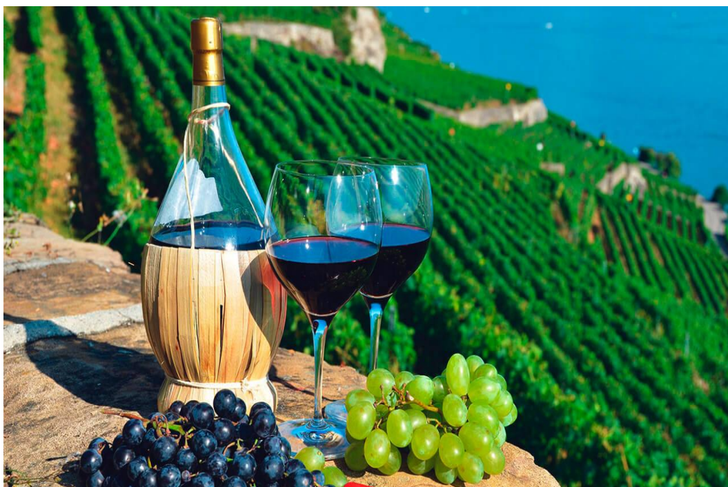
Рис.4.Виноградники в Тасконы

На территории Европейского Союза сельский туризм получил широкое развитие и является одним из наиболее привлекательных видов отдыха. Однако, фермеры в менее развитых странах ЕС, используют туризм как инструмент диверсификации агробизнеса, а не как основной источник дохода.