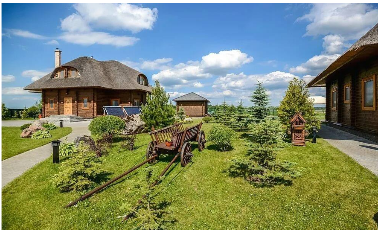
Рис.6. Усадьба в сельской местности

Практически все регионы Узбекистана имеют необходимые ресурсы для развития сельского туризма. Это разнообразные природные условия, от предгорных и горных ландшафтов до степных и пустынных территорий, где повсюду присутствуют сельские поселения с прилегающим к ним сельским угодьям – полям, садам, виноградникам, пастбищам. А находящиеся в непосредственной близости от этих селений всевозможные памятники природы, мемориальные места поклонения, архитектурные и археологические памятники могут быть использованы как дополнительные экологические и культурно-познавательные объекты для посещения и ознакомления с ними. Очень часто сельский туризм смешан вместе с экологическим туризмом и отделить один вид туризма от другого порой трудно. Из такого переплетения и взаимодействия, сельский и экологический туризм только выигрывают.