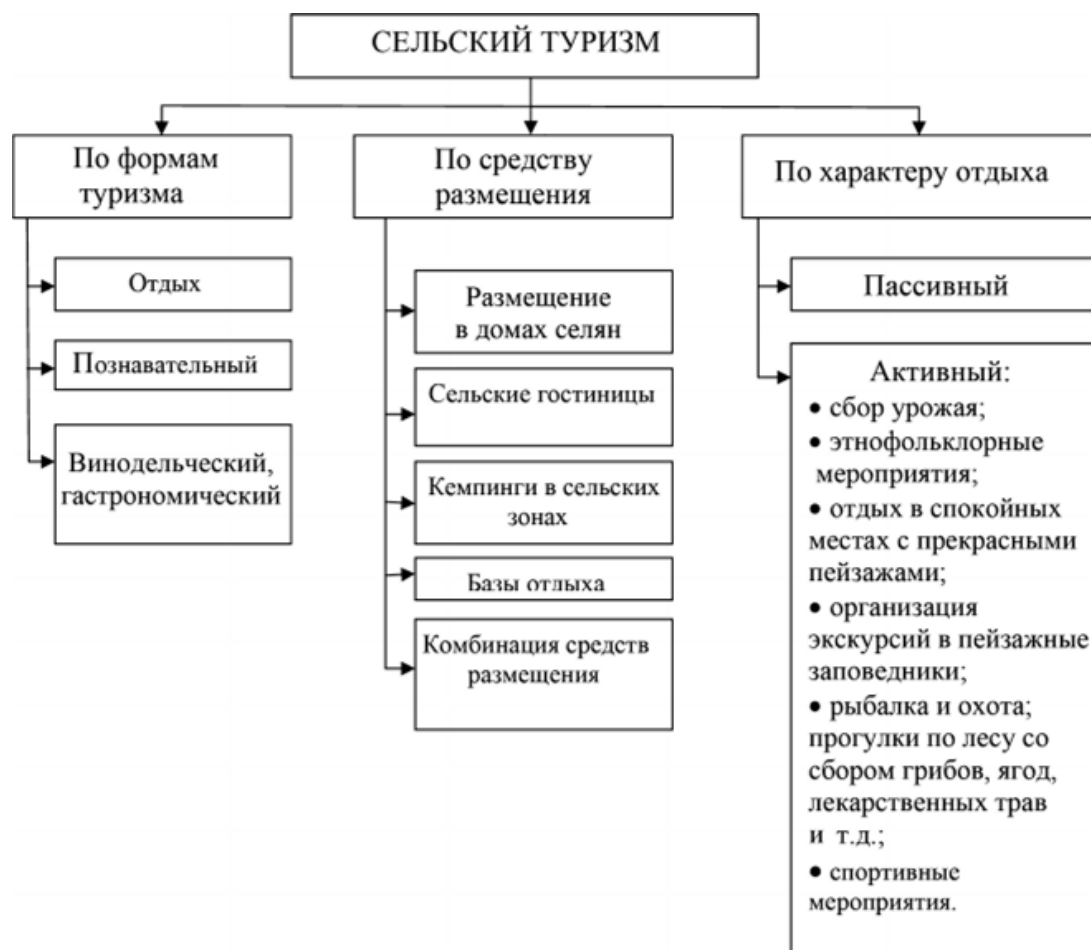
Рис.1. Виды сельского туризма

Сельский туризм, как новый вид отдыха, может играть большую роль в туристическом сегменте Узбекистана, используя как въездной, так и внутренний поток туристов. Благоприятные экологические и климатические условия, необходимая инфраструктура, уникальная этнографическая культура с традиционным гостеприимством – все это присутствует в нашей стране и может быть использовано для агротуризма. (Рис.1)