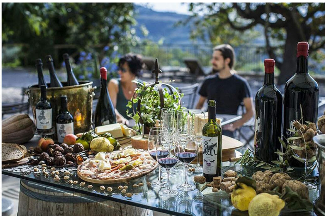
Рис.2. Винный гастрономический туризм во Франции

Формы размещения туристов в меньшей степени предполагают проживание с фермером; туристы размещаются в коттеджах.