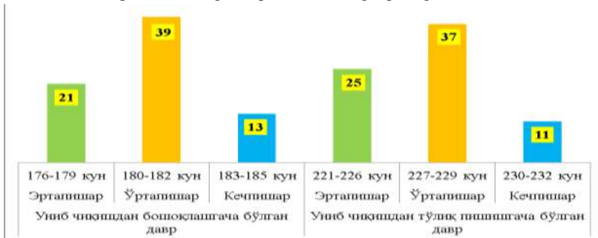
1-rasm. 42 nd IDON ko'chatzori namunalarning o'suv davri, dona (G'allaorol, 2020-yil).

namuna andozaga yaqin boshloqladi, 39 ta namuna esa andoza navdan 3-6 kunga kech boshloqlagani kuzatildi. Namunalarning unib chiqishdan pishishgacha bo'lgan davri o'rtacha 221 kunni tashkil etdi. Andoza «Makuz-3» navining unib chiqishdan to'liq pishishgacha bo'lgan davri 220 kunni tashkil etdi. 28 ta namuna andoza naviga nisbatan 2-4 kun ertapishar ekanligi aniqlandi (1-rasmga qarang).