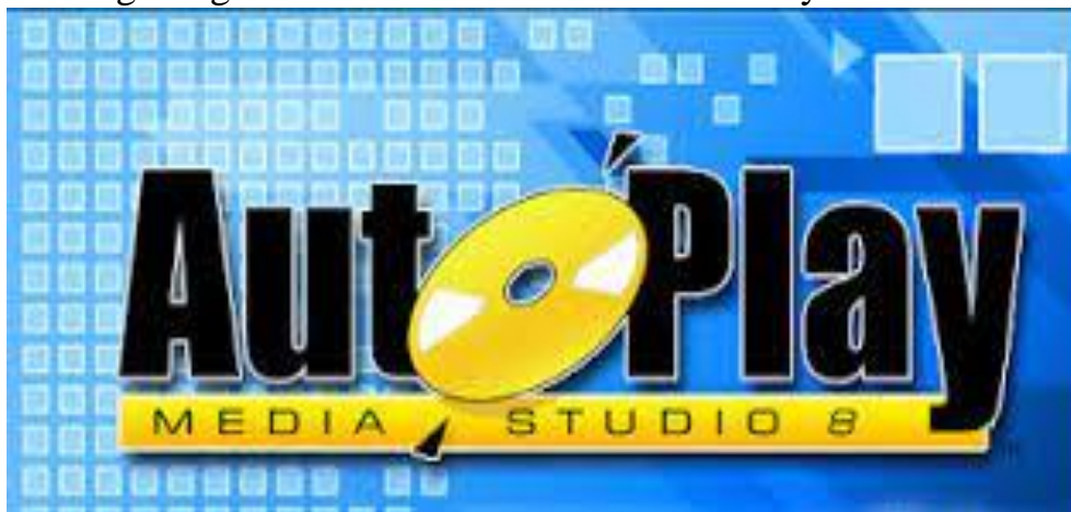
1-rasm. Auto Play dasturining boshlang'ich oynasi