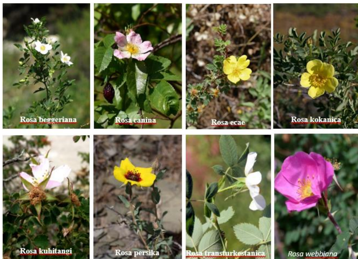
2-rasm: Ko'hitang botanik geografik rayonida tarqalgan Rosa L. turlarining foto suratlar.

ajralib turadi. Bu esa turkumga mansub bo'lgan turlarning yangi populyatsiyalarini o'rganish muhimligini ko'rsatadi.